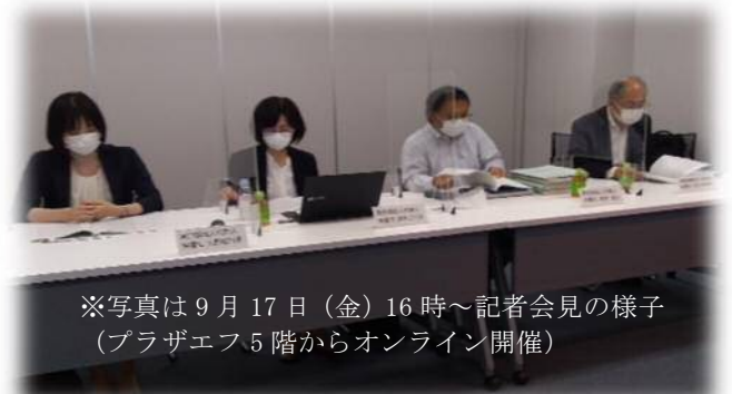
※写真は9月17日(金)16時～記者会見の様子(プラザエフ5階からオンライン開催)

http://www.coj.gr.jp/trial/topic_210917_01.html