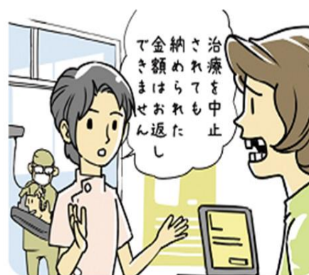
歯科自由診療契約